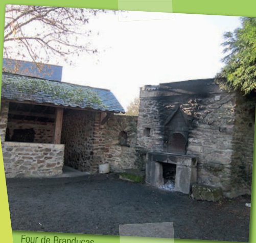
Four de Branducas

Respectons les espaces naturels et protégés Restons sur les sentiers balisés Ne laissons ni trace de notre passage, ni déchets Respectons la flore Respectons la faune sauvage et la tranquillité des troupeaux Respectons le code de la route Gardons les chiens en laisse Refermons les clôtures et les barrières